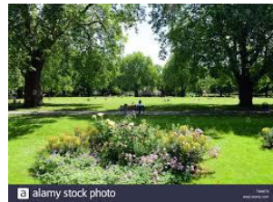
Park, Trails, Open Space