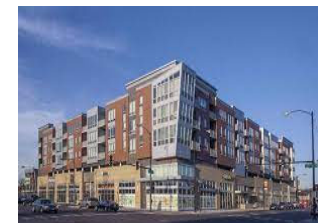
Affordable Housing/Mixed Use